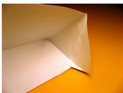
An anderer Seite wiederholen