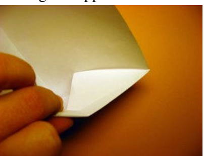
Vorne vollständig anlegen