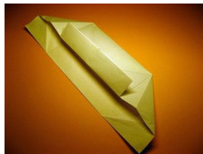
Freiliegende Kante hochfalten