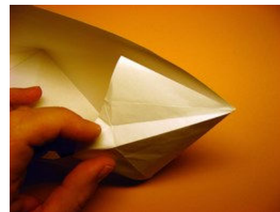
Nach vorne ragendes Dreieck in die Figur klappen.