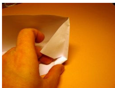
Spitze des Dreiecks am zweiten Falz wieder herausholen