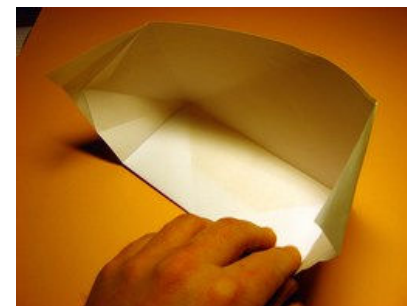
Umdrehen und öffnen