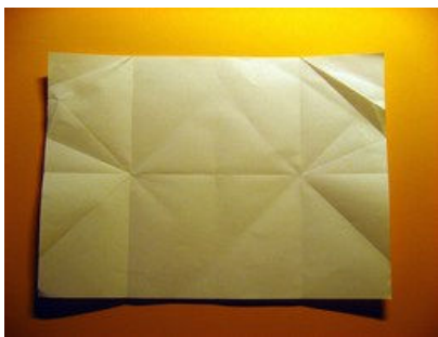
Vorgefaltetes Papier. Dekor liegt unten-oben.