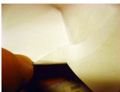
nach hinten-innen klappen