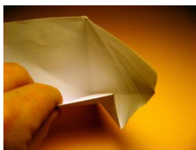
Seitliche Fläche teilweise unter die Figur klappen