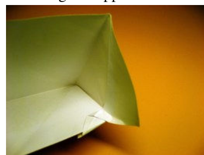
Aussehen der Figur danach